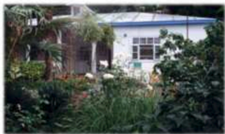
Дача Чехова в Гурзуфе

стёр» – одну из первых пьес, созданных специально для Московского Художественного театра.