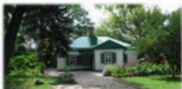
Домик, в котором родился писатель

Детство Чехова прошло в доме на углу Монастырской улицы и Ярмарочного переулочка. На первом этаже помещалась лавка отца, на втором – квартира.