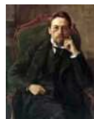
Работа художника О. Э. Бразда (1898)

Портрет удостоился противоречивых оценок современников. Критика упрекала автора за будничность, с которой он представил Чехова. Только А. Н. Бенуа особо отмечал, что будущие поколения будут благодарить художника за объективный «документ». Размноженный в бесконечных копиях портрет, который сегодня хранится в Государственной Третьяковской галерее в Москве, стал хрестоматийным, обязательным во всех учебниках и материалах об А. П. Чехове.