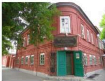
В этом доме произошло его детство

Это крохотное сооружение с обустроенным сквериком вокруг, с цветами и кустарником, дорожками и скамейками.