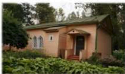
Главный дом в Мелихово

В 1892 г. Чехов покупает имение в Мелихово. Давняя мечта жить в деревне, быть землевладельцем осуществилась. В этой усадьбе он написал 42 своих произведения! Многие из них всемирно известны: «Палата № 6», «Человек в футляре», «Бабье царство», «Случай из практики», «Ионыч», «Крыжовник». Здесь же был написан большой «деревен-