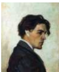
Работа художника Н. П. Чехова (1884)

Николай Павлович оставил несколько работ, посвящённых брату Антону. Среди них портрет, выполненный в год окончания А. П. Чеховым Московского университета и начала работы уездным врачом в Воскресенске (ныне г. Истра). Портрет выполнен в характерной для Николая Чехова тёплой, светлой манере. Находится в Доме-музее А. П. Чехова в Москве.