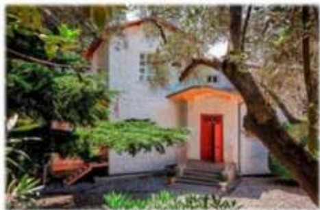
«Белая дача» в Ялте

Туберкулёз, по выражению самого писателя, преследовавший его с 10 лет, не оставлял выбора: Чехову требовались сухой жаркий воздух и солнце. В 1898 г. семья Чеховых решила обосноваться в Ялте. Их дом из белого камня прозвали «Белой дачей», ставшей местом культурного паломничества и всеобщего притяжения.