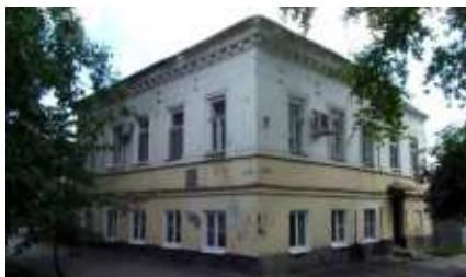
Дом инспектора гимназии Дьяконова