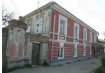
Дом купца Лободы