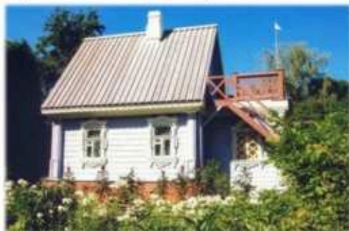
Флигель, где была написана «Чайка»

ский цикл): «Мужики», «На подводе», «Новая дача», «По делам службы», повесть «Три года», пьесы «Чайка» и «Дядя Ваня».