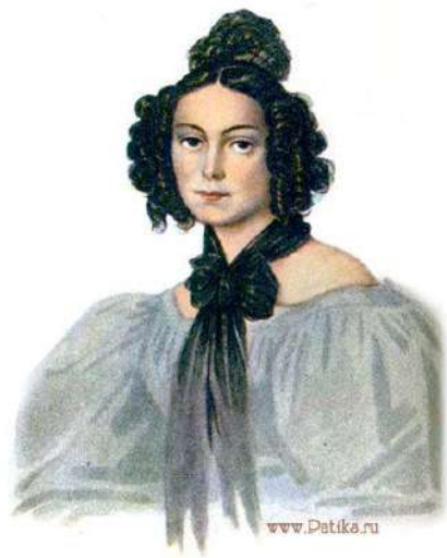
Камилла Петровна ИВАШЕВА, урождённая ЛЕ-ДАНТЮ (1808–1839)

Ещё 10 лет прожила в Сибири и только после амнистии переехала в Москву. До конца жизни сохранила связь с декабристами, и они не оставляли её. В 1858 г. она умерла.