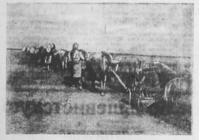
В колхозе «Волшебник» Буденновского района используют на севе все тагалоые силы. В упряжках ходят не только быки, но и коровы. На снимке: Пахота на быках в колхозе «Волшебник».

ГОБИЦКОЕ. (По телефону). Комсомолы колхоза «Ленинский путь» взяли шефство над тракторной бригадой, работающей на полях этой артели. Они собрали для трактористов 45 книг и брошюр, принесли патефон и различные музыкальные инструменты. Постоянно наводят порядок в вагончике. Трактористам после трудового дня есть где отдохнуть и есть чем развлечься.