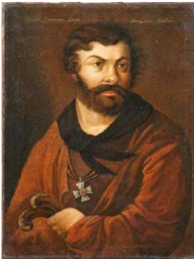
Лангер В. П. Портрет Д. В. Давыдова 1819