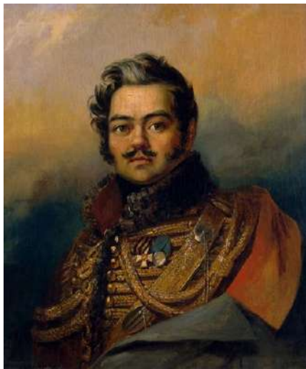
Доу Д. Портрет Д. В. Давыдова. До 1828 г.