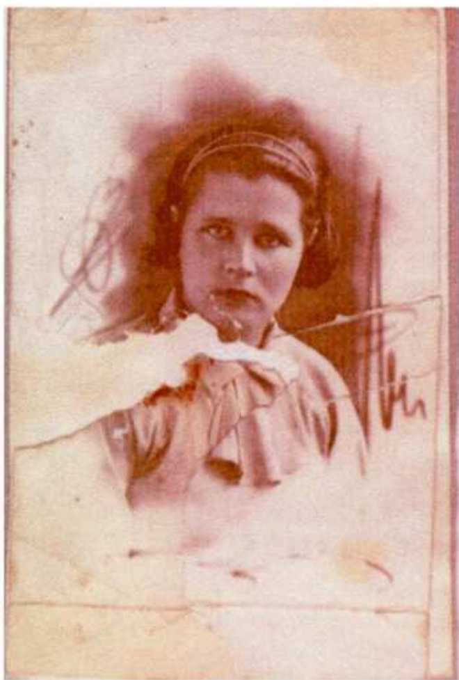
Фотография жены, находившаяся в нагрудном кармане в течение всей войны. Пробита вместе с документами при ранении. Возможно, спасла ему жизнь.