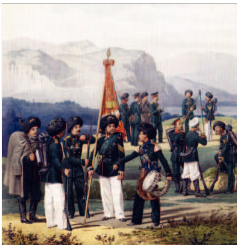
Державы верные сыны