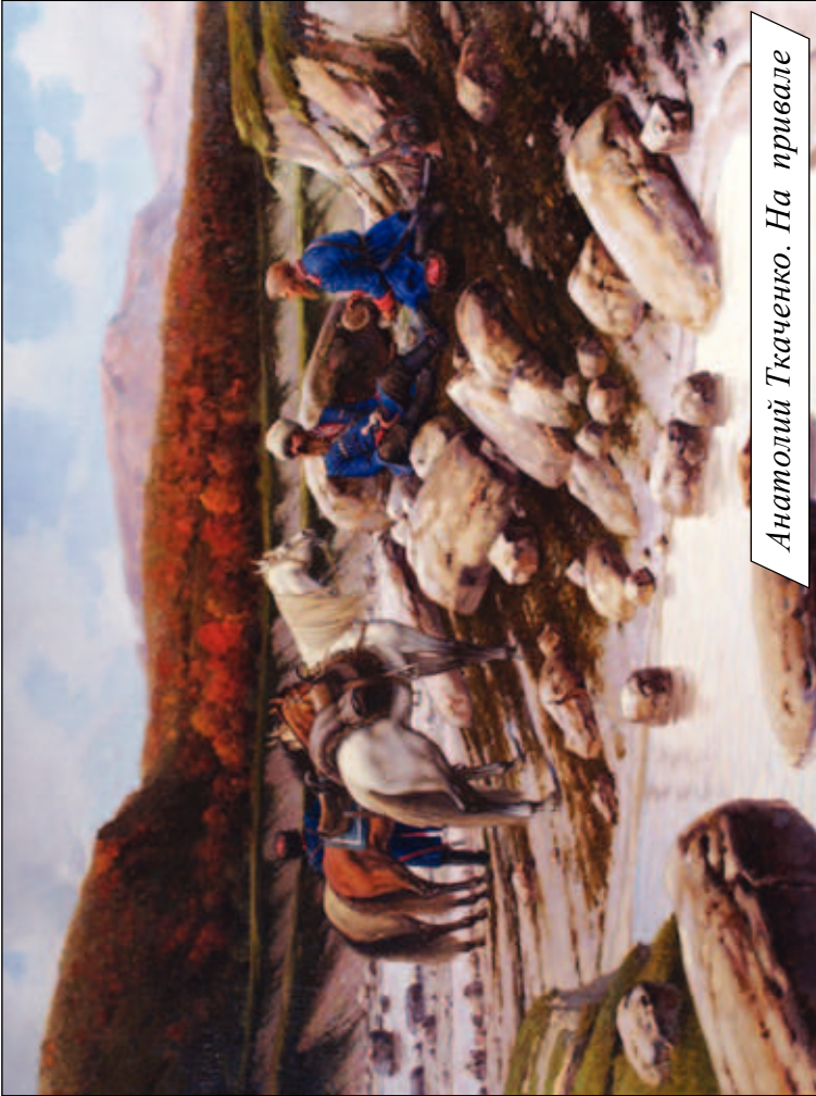
Анатолій Ткаченко. На привалі