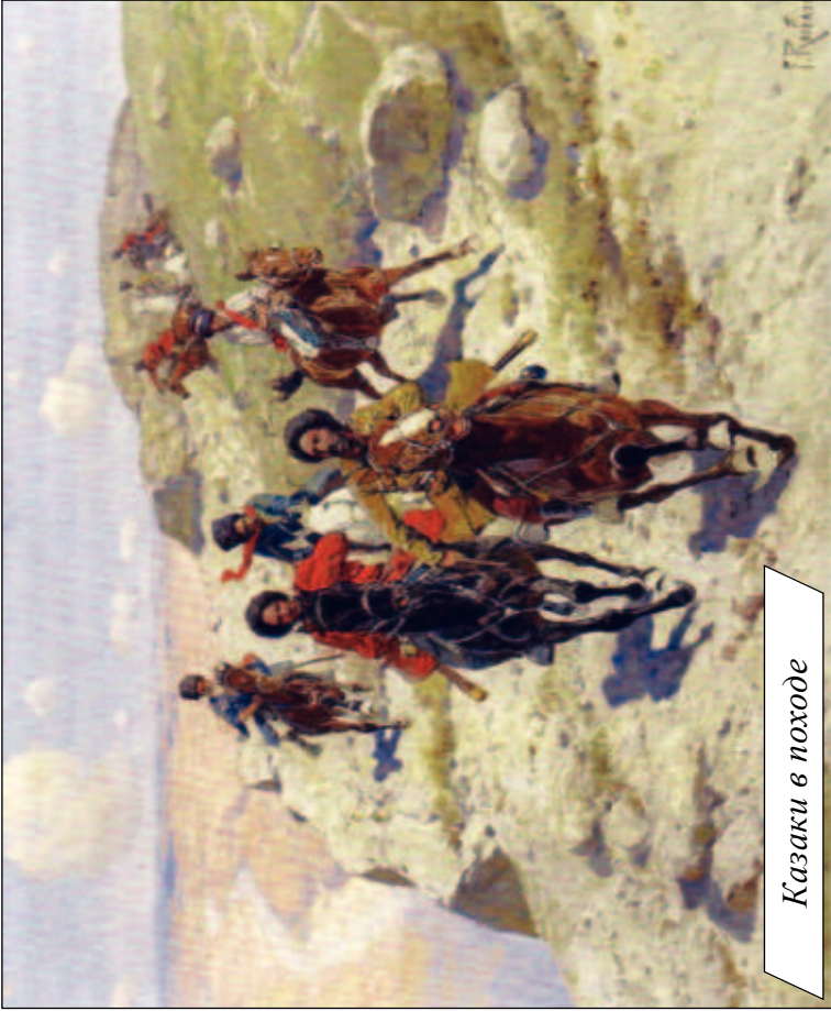
Казакы в походе