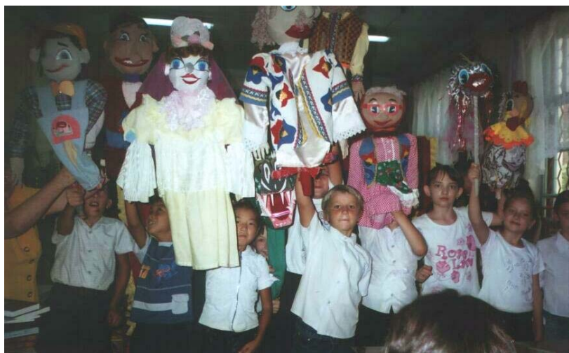
Кукольный театр «Кудесники» приветствует юных читателей г. Моздока

В период с 7 по 10 сентября во всех библиотеках района прошел День открытых дверей «Добро пожаловать, Читатель!» , в рамках которого состоялись экскурсии-знакомства населения с работой библиотек, обзоры новинок у книжных выставок, громкие чтения и другие мероприятия.