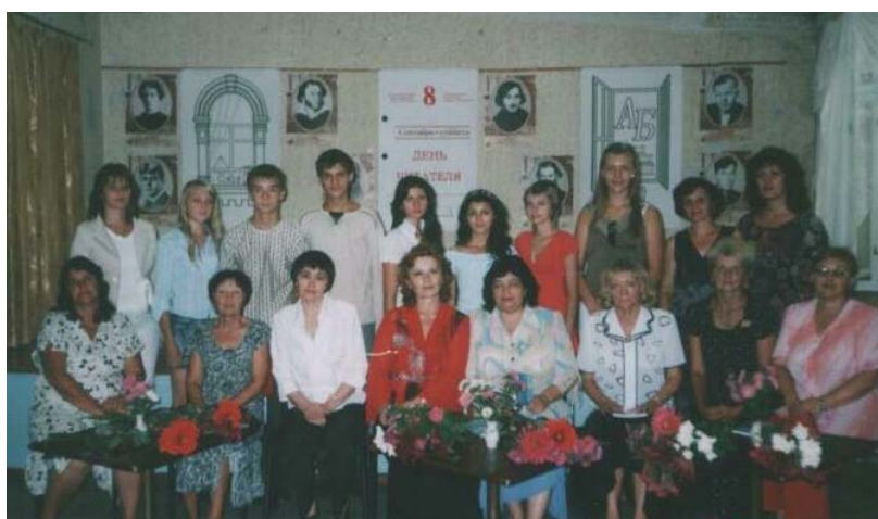
Презентация литературного сборника «Опрокинутые облака»